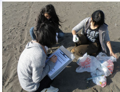
◎ビーチコーミング