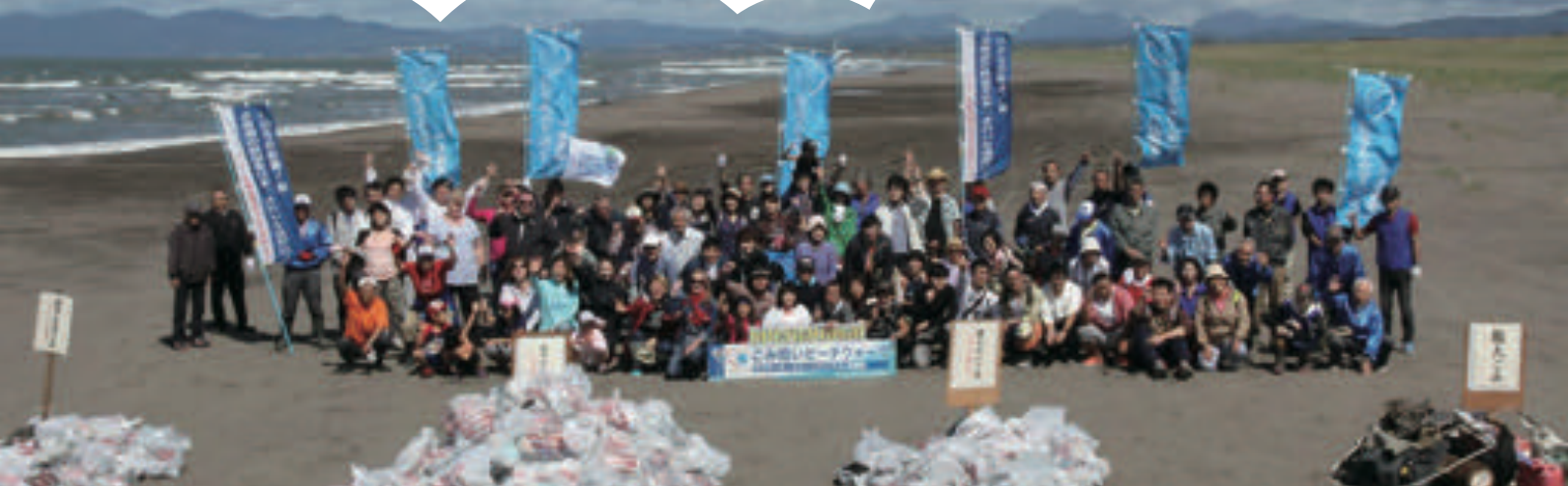
第2回活動終了後の記念写真