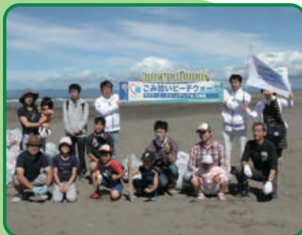
第2回のようなす：海辺がとてもきれいになりました!