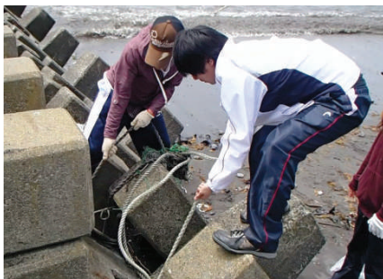
挟まったロープを引っ張る