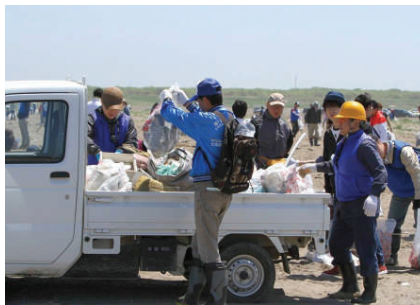
広いため車を使って運搬