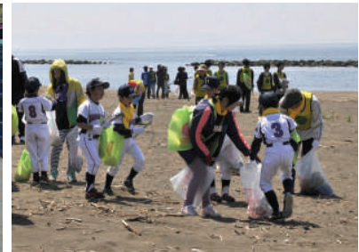
地元の少年野球団も活躍