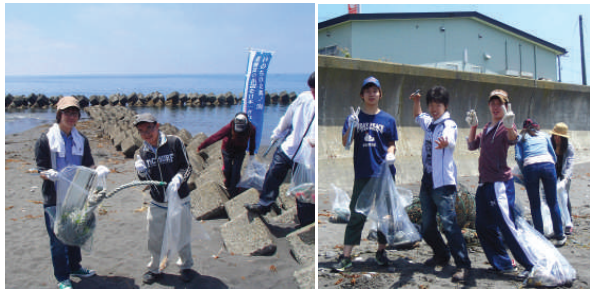
いつも頑張ってくれるPコネの学生たち