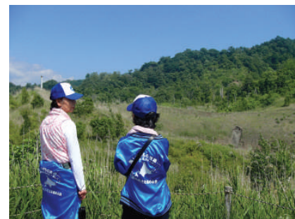
有珠山西口火口の散策