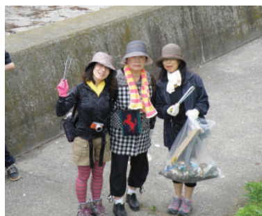
ユーラシア協会の方々