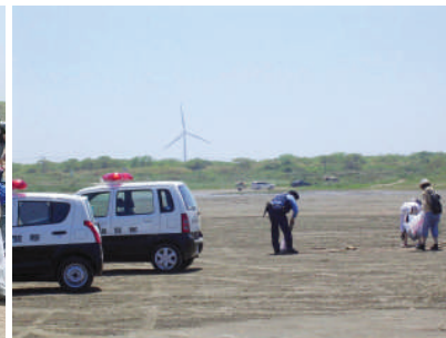
警官も拾ってくれました