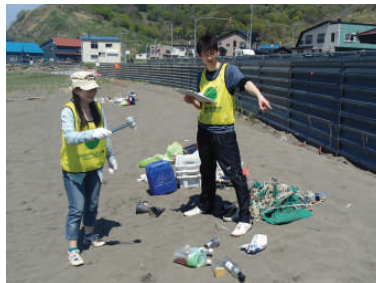
ビーチコーミングも継続