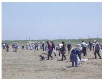
家族連れや学生、友人グループ、企業での参加など