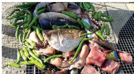
ブリや毛ガニ、アワビ鍋など