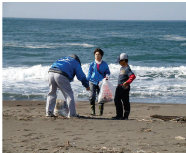
晴れた中でのゴミ拾い

細かいプラスチック片が多く、1000個以上ゴミをカウントした班も。大きな漂着ゴミは少なかったですが、テラポットのところには相変わらず多く、190kgほどのゴミを回収しました。