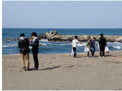
分かれてビーチコーミング