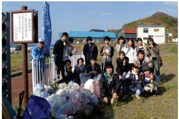
ビーチコーミングメンバー