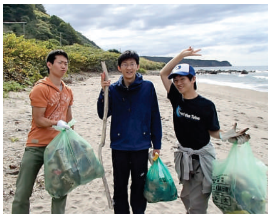
野塚野営場前の浜の清掃

20人が参加し、一泊二日で行われました。初日は、野塚野営場の浜辺でのゴミ拾い。細かいプラスチックゴミや、地中に埋まったゴミがたくさん。2日目は、幌武意海岸にてゴミ拾い。ダイビング等をやらなかった人は、述べ7時間もゴミ拾いを行う等、充実した海浜清掃に。