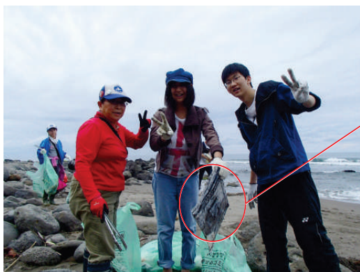
海外からの漂着ゴミも多い