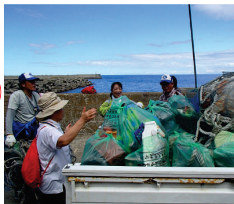
幌武意漁港の奥の清掃