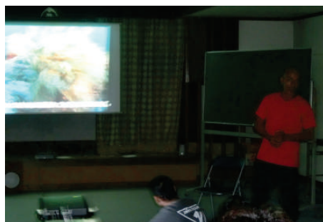
トドとの共生について