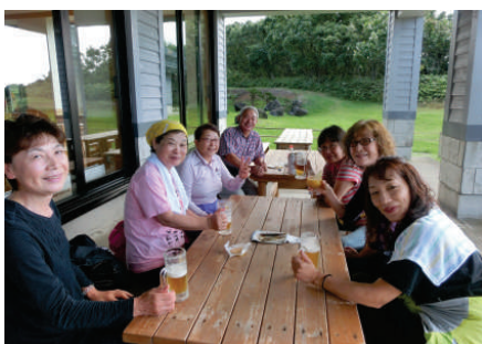
清掃・入浴後の一杯は格別