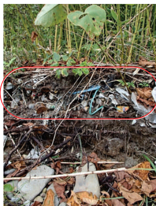
地層のように堆積したゴミ