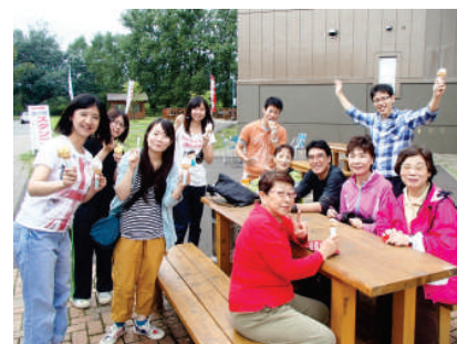
余市道の駅でジェラートを