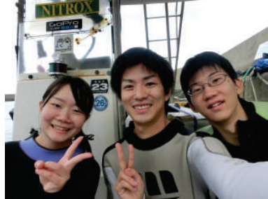
クルージングと体験ダイビング