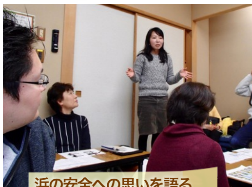
浜の安全への思いを語る