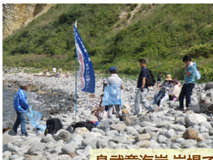
島武意海岸 岩場での活動

その後、温泉・岬の湯で汗を流し、夜は地元の人も交えて32名で勉強会を実施。酪農大・獣医学部生が、修士論文発表の練習になるので毎年協力してくれています。バンドウイルカの生態など、積丹半島周辺での活動からの研究発表でした。活発に質問が出され、有意義な勉強会となりました。2日目はクルージング、ダイビングのアクティビティの他、「積丹町クлинаップ」とのコラボで、幌武意漁港を清掃しました。積丹町クлинаップが終わっても、漁港の他にゴミが多かった海岸のゴミも拾いました。自然の中で有意義な2日間でした。