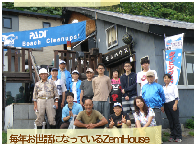
毎年お世話になっているZemHouse