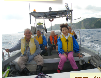
積丹ブルーをクルージング