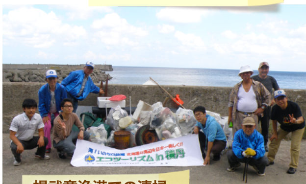
幌武意漁港での清掃