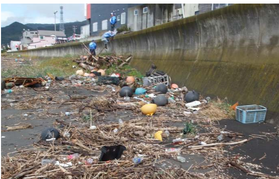
昨年の清掃前の様子