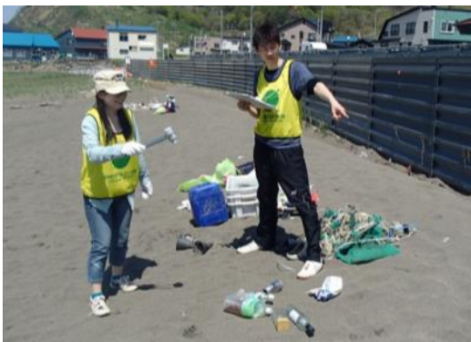
ビーチコーミングも行います