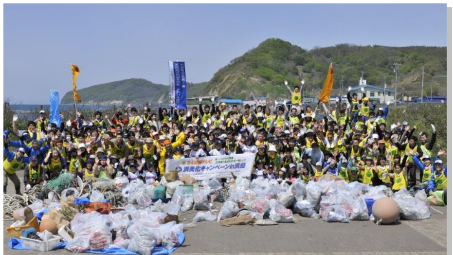
—昨年は24時間テレビとの共催で、280人以上が参加しました。