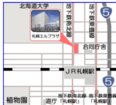
札幌エルプラザ西側ローソン前集合