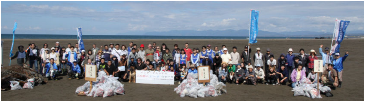
第3回活動終了後の記念写真

The International "Gomi Hiroi" Beach Walk 秋の石狩浜をきれいに!! あそビーチ清掃のあと石狩鮭祭りも!!