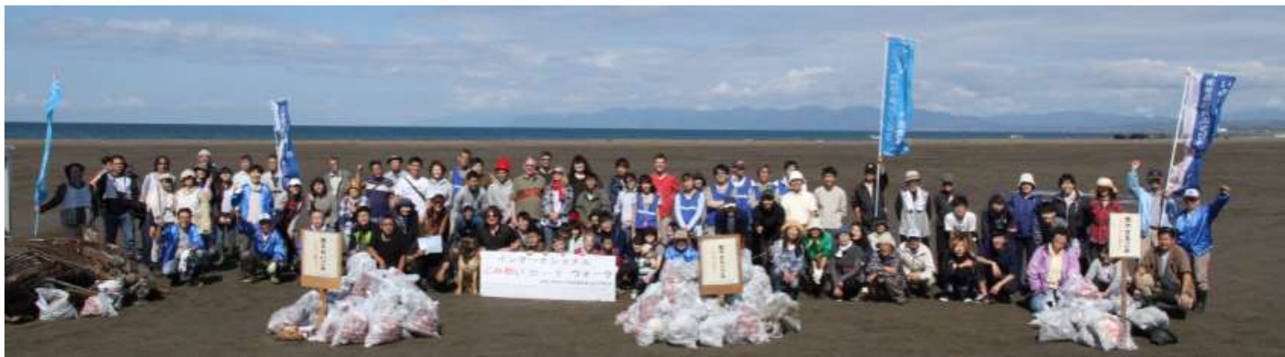
第3回活動終了後の記念写真