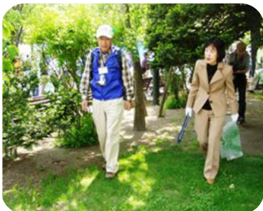
ゴミ拾いをする高橋知事

6月1日は、全道一斉の清掃活動の日、6月22日は洞爺湖町海浜清掃を予定しています。