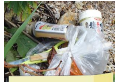
バーベキューのゴミ