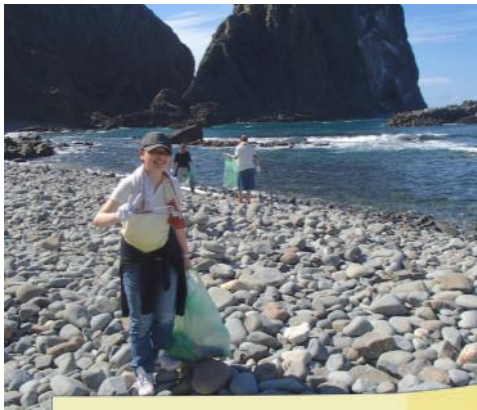
足場の悪い岩場での清掃