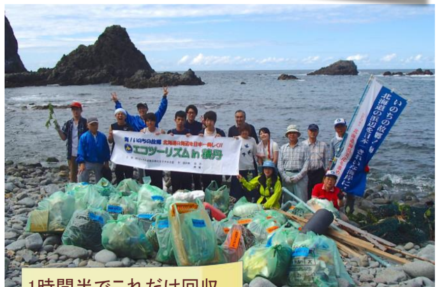
1時間半でこれだけ回収