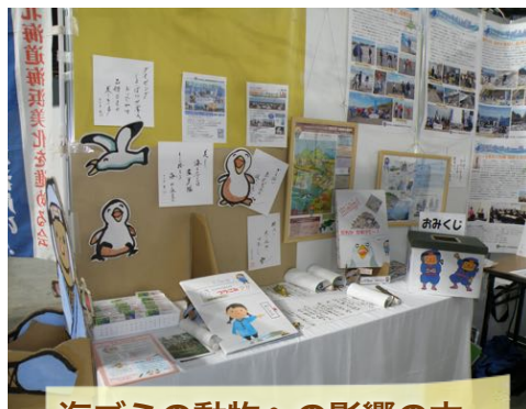
海ゴミの動物への影響の本