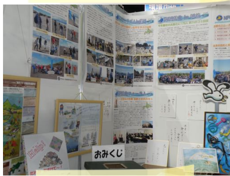
パネルや川柳など