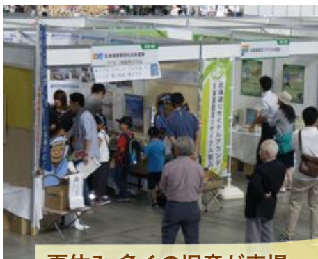
夏休み 多くの児童が来場

札幌市主催の「環境広場さっぽろ2019」が札幌ドームにて行われました。「環境広場さっぽろ」は小学校低学年を対象とした体験型環境教育の場です。道庁の環境局から、共催出展のお誘いがあり、海岸清掃を広めるための良いチャンスだと喜んで共催させて頂きました。来場者の方々に海岸のプラスチックごみの害や、清掃活動、漂着ゴミの説明などをしました。このような出展で、海岸のゴミがどこから出てくるのか、子どもにも大人にも考えてもらえたら嬉しいと思います。