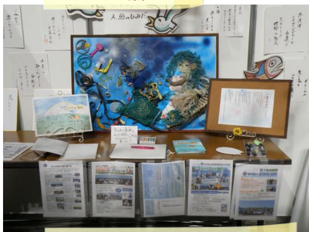
漂着ゴミアート「人魚のなみだ」