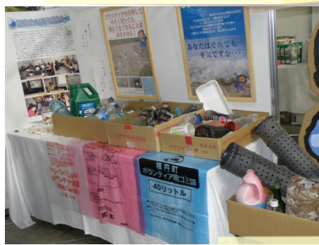
海岸漂着ゴミの展示