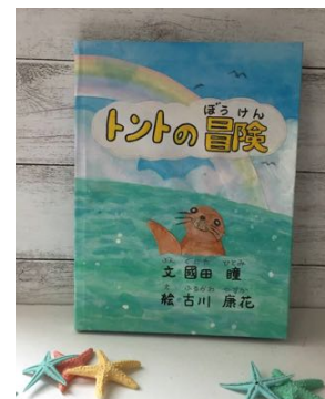
國田氏・古川氏作成の絵本