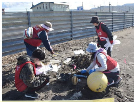
ゴミを分類しながら拾う

53名の参加の元、暑いくらいの良い天気にも恵まれ、ビーチコーミングも清掃活動もみんな楽しくできました。参加者は「思った以上に細かいプラスチックがたくさんあり驚いた。ペットボトルが、数は多くないですが、とても目立ったので印象が良くない事もわかった。マイクロプラにならないような活動を我々もしていく必要を感じた」と感想を述べ、とても有意義な活動になったと嬉しくなりました。活動後はコミセン「きらり」で昼食をとり、100人前作った豚汁も完食でした。昼食の後はやっぱり温泉入浴。浜益温泉で汗を流し、露天風呂につかりながら本日の反省会をして、社会貢献の体験を反芻して、バスに心地よく揺られて、帰路に着きました。