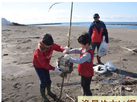
漁具や太い綱も協力して回収